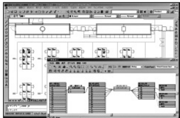
図表 4 上: 平面レイアウト図、下: 接続ポート配線図