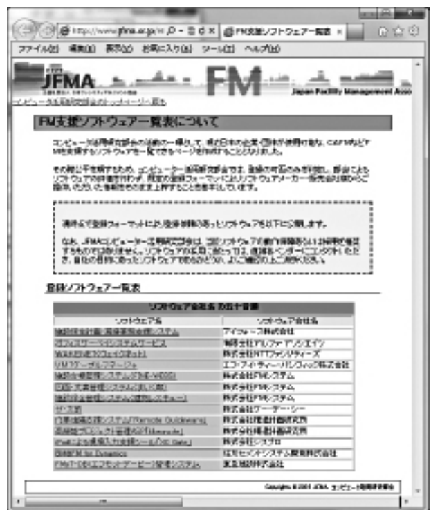
図表 2 FM 支援ソフトウェアホームページ画面