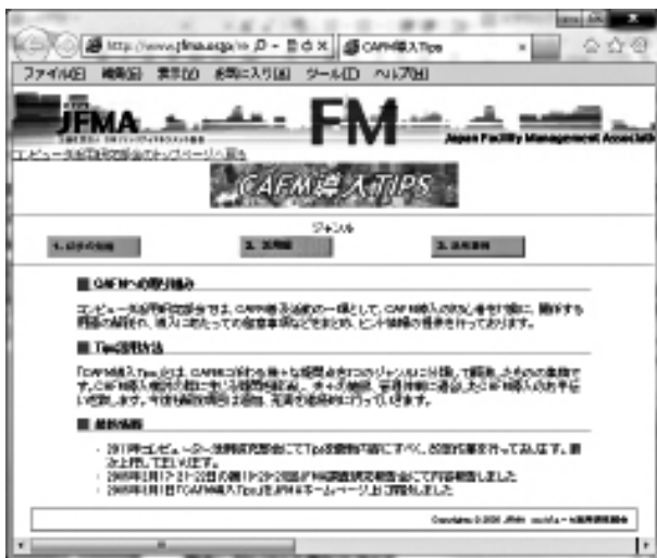
図表 1 CAFM 導入 TIPS ホームページ画面