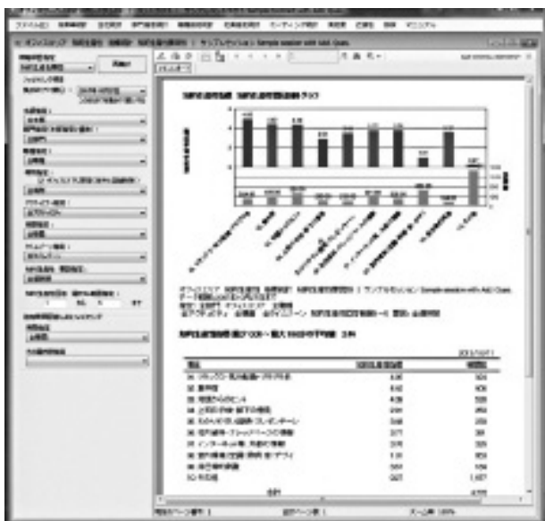
図表 3 上: アンケート回答表、下: アクティビティグラフ