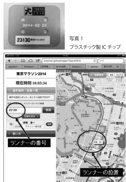
図表6 ランナー番号を入れると(左)、地図に現在位置が表示(右)

このような現在位置確認システムを FM で利用すれば、建物内のインベントリー (家具・備品・財産等の在庫調査や棚卸) サービスで威力を発揮する。また、非常時の「〇〇がどこにあるのか」の検索にも役立つ。今後は FM でのコンピュータ活用においても先端技術の応用事例が期待されはじめている。