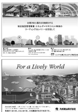
1/2頁モノクロの場合